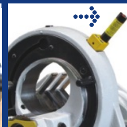
Láser integrado para identificar claramente las zonas de separación.