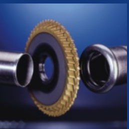
Mecanizado en frío, en ángulo recto y sin rebaba: ideal para sistemas de montaje a presión!