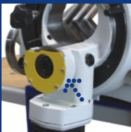
Segundo alojamiento de hojas de sierra para separar codos de tubo.