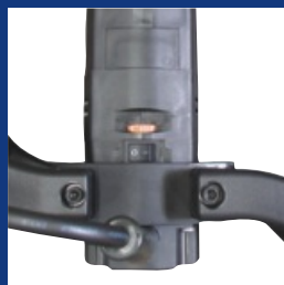
Motor de alta potencia con protección contra sobrecarga y mangos ergonómicos.