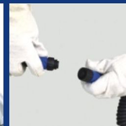
Conexiones con acoplamientos que se atornillan rápidamente.