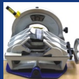
Mordazas deslizantes de acero endurecidas: opcionalmente también con cabezales de sujeción de acero fino.