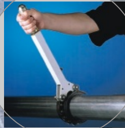
Corte de tubos al instante