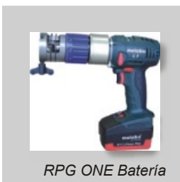
RPG ONE Bateria