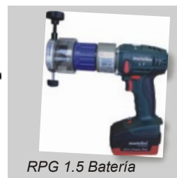
RPG 1.5 Bateria