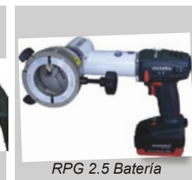
RPG 2.5 Bateria