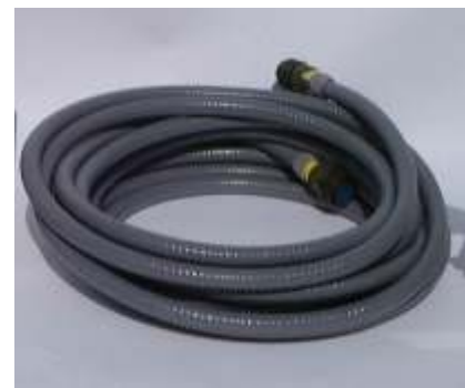
Cable de control , longitud estándar de 10 mt, bajo pedido hasta 40 mt

La cámara es muy compacta. Hecha de aluminio, como el soporte universal.