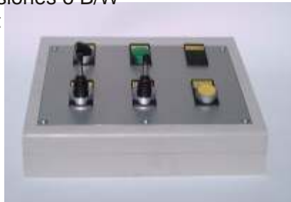
Control consola , con los siguientes ajustes: