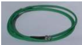
Cable de vídeo 1 mt para la conexión del monitor a la consola