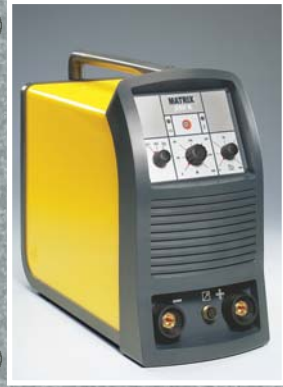
MATRIX 250 E MATRIX 400 E