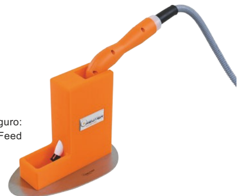
Soporte práctico y seguro: Soporte para mango AutoFeed

4) Opcional – otras longitudes bajo pedido