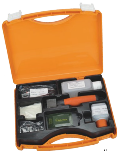
Set de marcado (opcional)

Nuestros sets Cleanox contienen todo lo que necesita para comenzar de inmediato: Mango de teflón con cable de tierra Pincel de fibra de carbono, electrolitos varios, caja de transporte, etc.